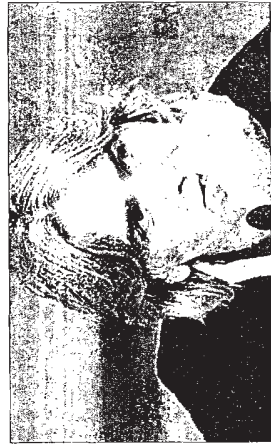
Ivan Zazzaroni ospite del Rotary Club